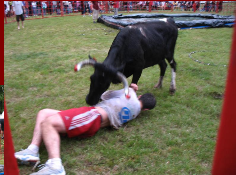
Course de vachettes

Merci au Comité des Fêtes pour cette animation