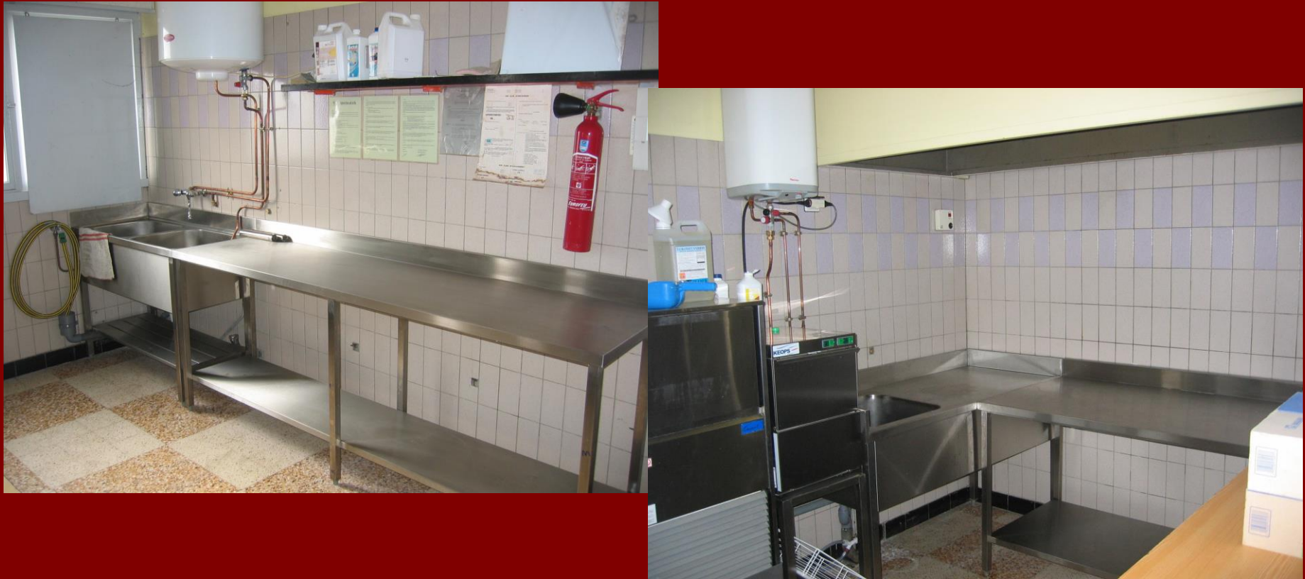
Plan de travail inox, nouveaux évier et lave verres