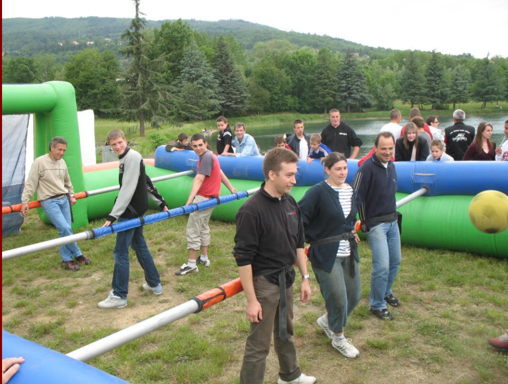
Baby foot humain