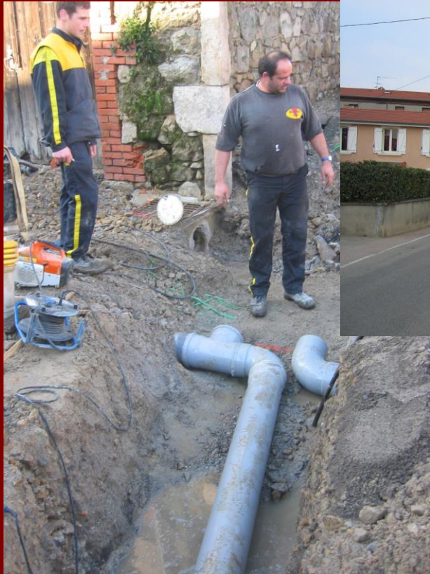
Reprises des réseaux