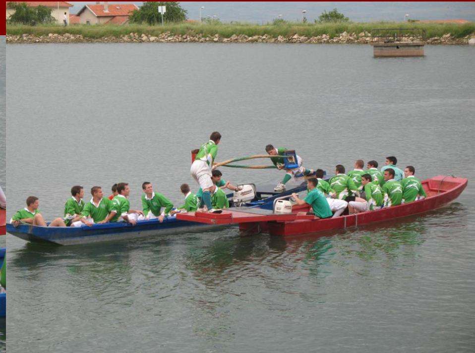
Joutes sur l'eau